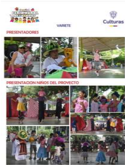
FERIA FAMILIAR VILLA OLIMPICA