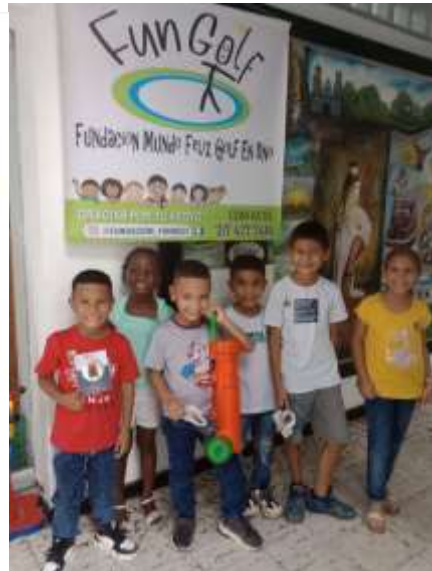
DE PASEO EN EL MUSEO