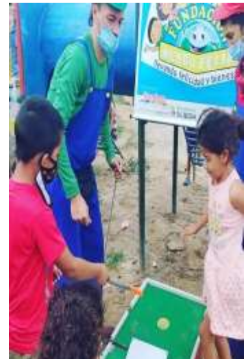
APOYO EN PANDEMIA