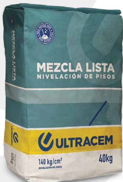
Presentación 40 kg