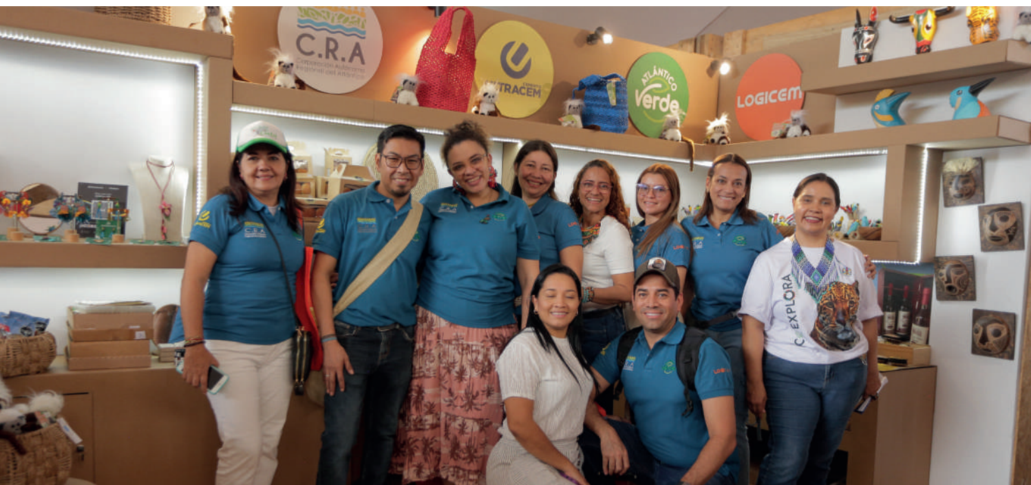
Atlántico Verde tuvo una destacada participación en la COP16, celebrada en Cali.

La plataforma comercial que impulsa a los negocios verdes del Atlántico es un modelo nacional. Gracias a esta iniciativa, los emprendedores de la región pueden vender sus productos y servicios que protegen la biodiversidad. Ultracem, como empresa ancla, juega un papel fundamental al estimular la creación de nuevas empresas, generar conocimiento, ofrecer financiación y fortalecer las capacidades de los emprendedores a través de formación y asistencia técnica.